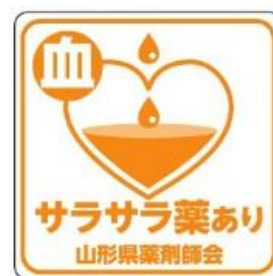
血液サラサラシール (20mm×20mm)