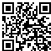
山形県薬剤師会HP ドーピング防止について